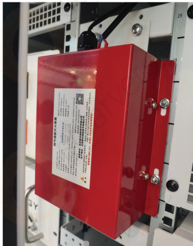
Малюнок 1. Система пожежогасіння.